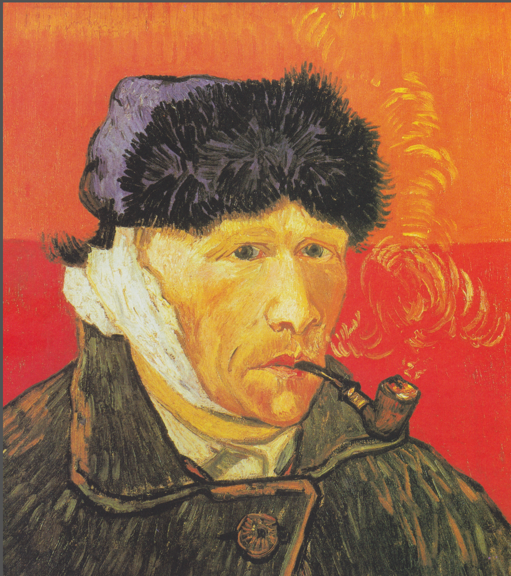
Autorretratu belarri bendatua eta piparekin. Vincent Van Gogh. 1889. Olio pintura mihisearen gainean. 51 x 45 cm. Kunsthau Zürich museoa, Zürich.